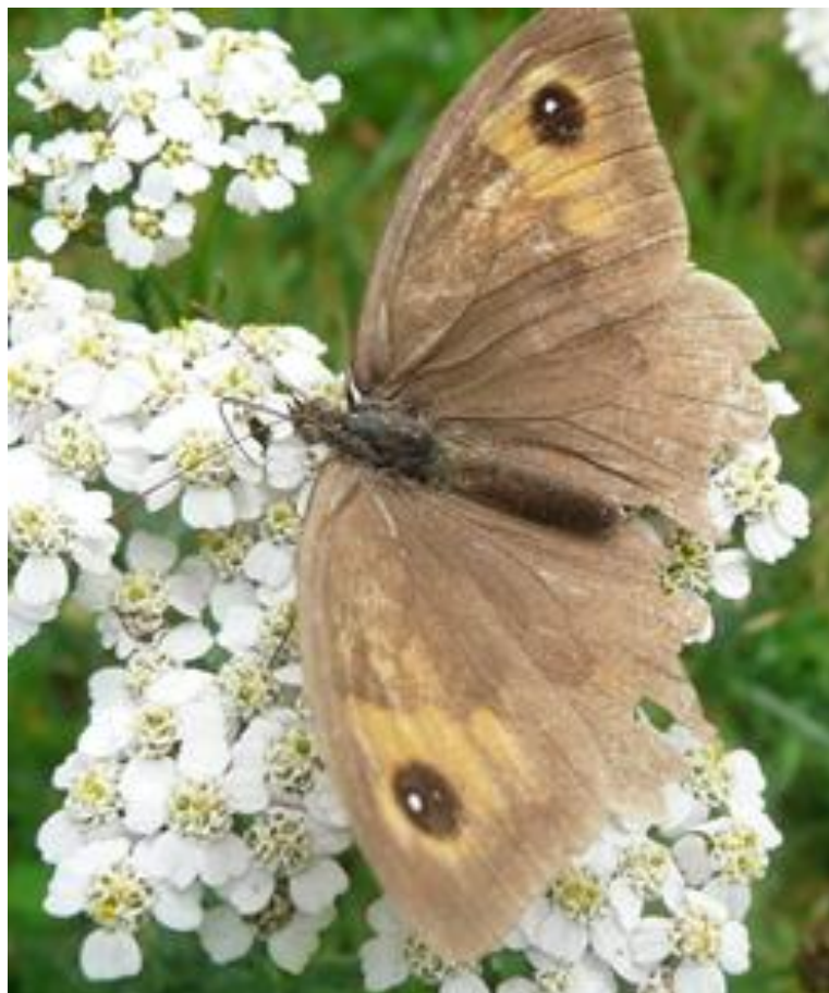
Bruin Zandoogje.