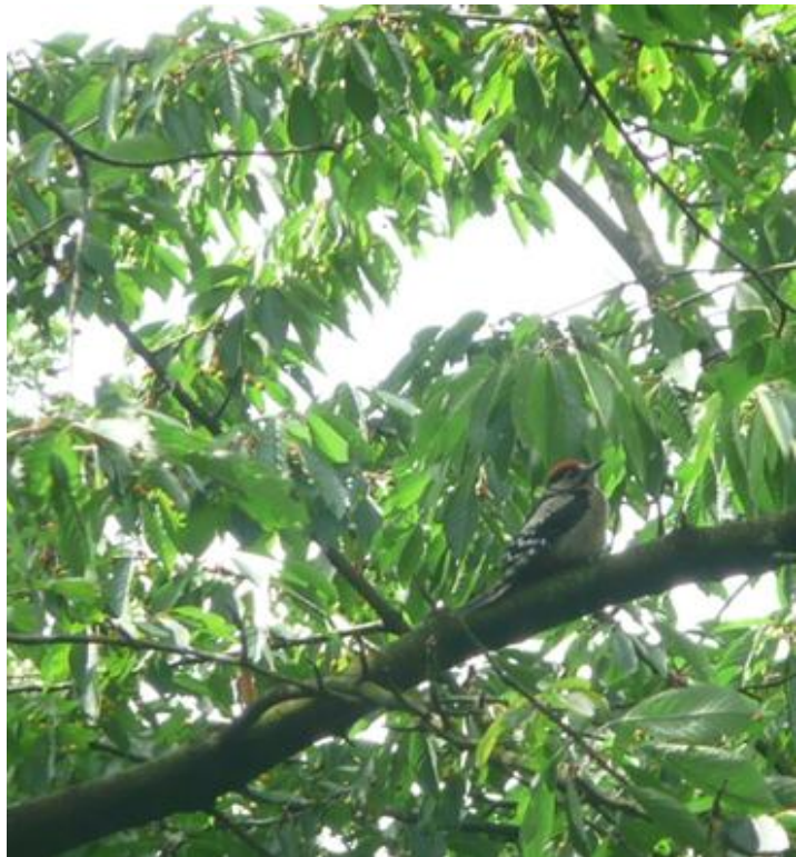
Jonge Grote Bonte Specht.