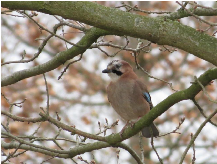
Vlaamse Gaai.

Wat hebben de Eekhoorn en Vlaams Gaai gemeen?